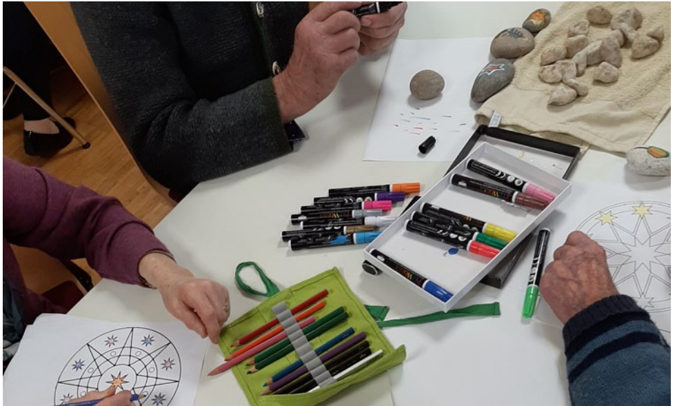
Kreativität im Seniorenfrühstück

8. Juli 2020 - Judentum - mit Pfarrer Müller